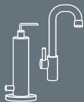
家庭用除水器 ウォーターサーバー